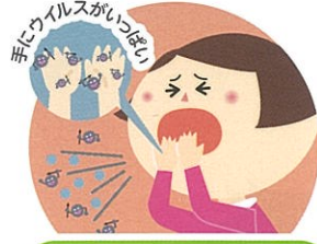
咳やくしゃみを手で おさえてしまったあと