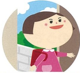
外から帰ったあと