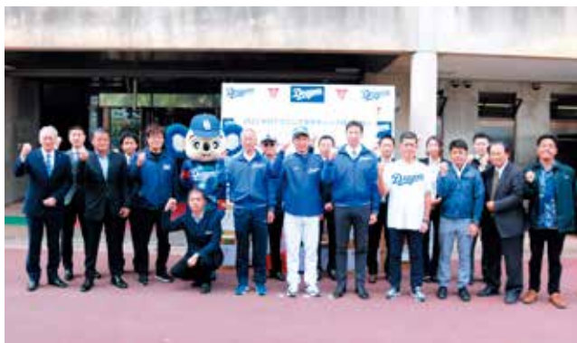
令和5年2月 中日ドラゴンズ春季キャンプ陣中見舞い(北谷町)

キャンプ地を訪問する際には、球団・クラブのホームページ、SNSなどで最新情報をご確認ください。