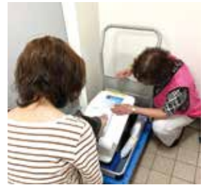
骨密度測定の様子

健康相談や健康チェックは無料で、沖縄県看護協会の看護職(看護師・保健師など)が対応します。お気軽にお越しください。