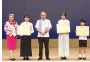
琉歌および図画コンテスト表彰式の様子

記念イベントでは、琉歌および図画コンテストの表彰や、プロの演者と県内の児童生徒が共演し、琉球王国時代にフォーカスした音楽・踊り・映像などで織りなす舞台公演を披露しました。