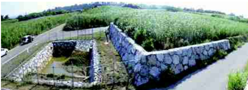
複合的に整備した赤土等流出防止対策施設