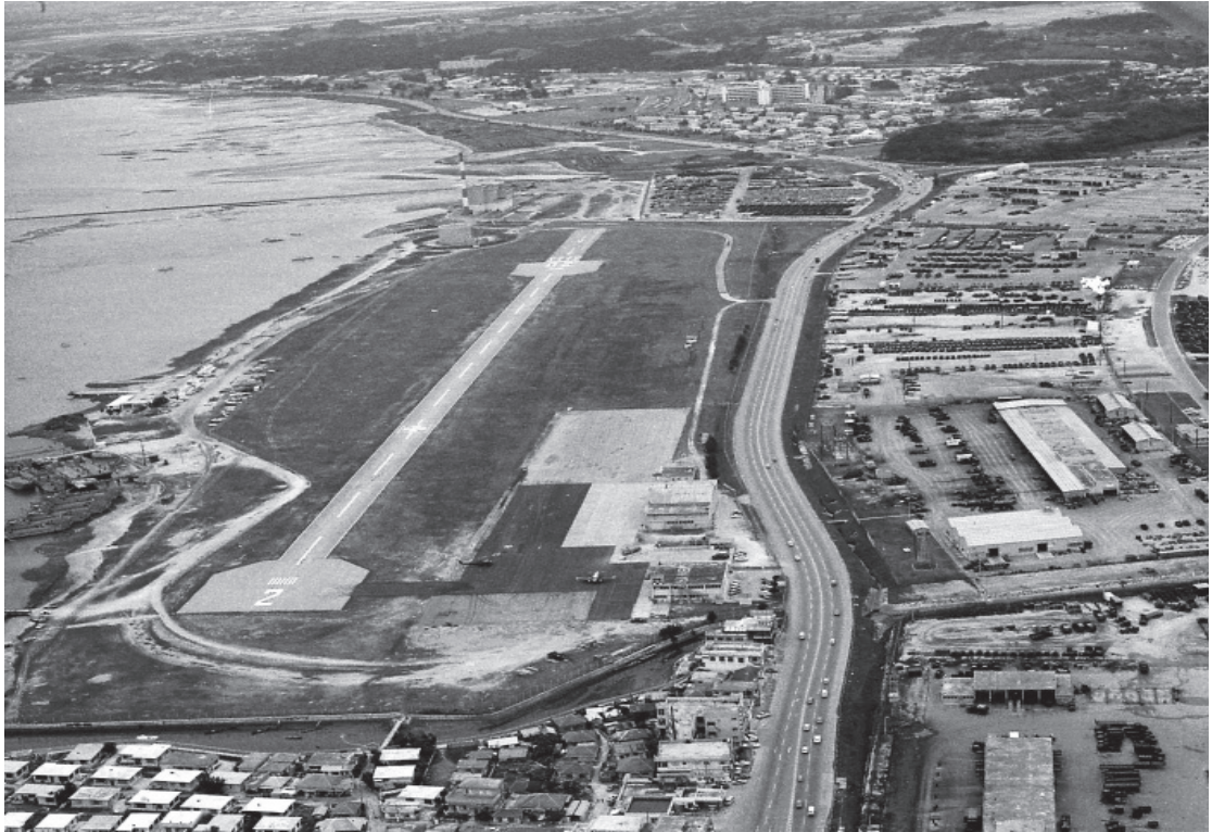
1972(昭和47年)撮影