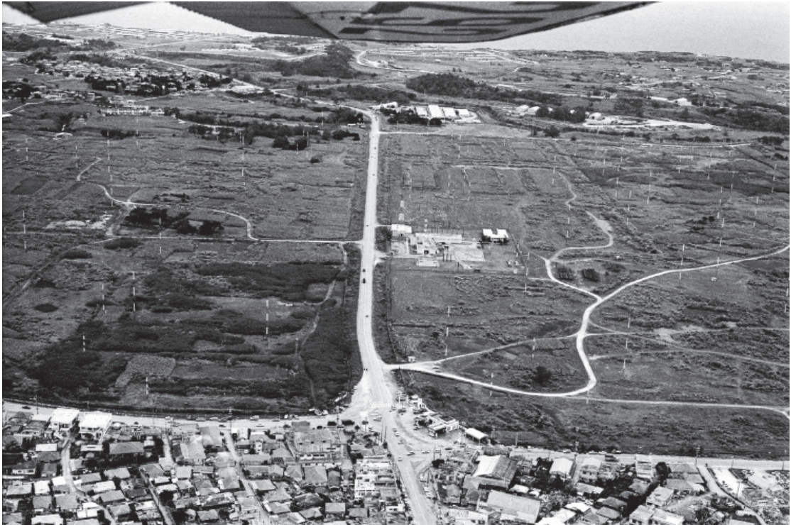
1972(昭和47年)撮影