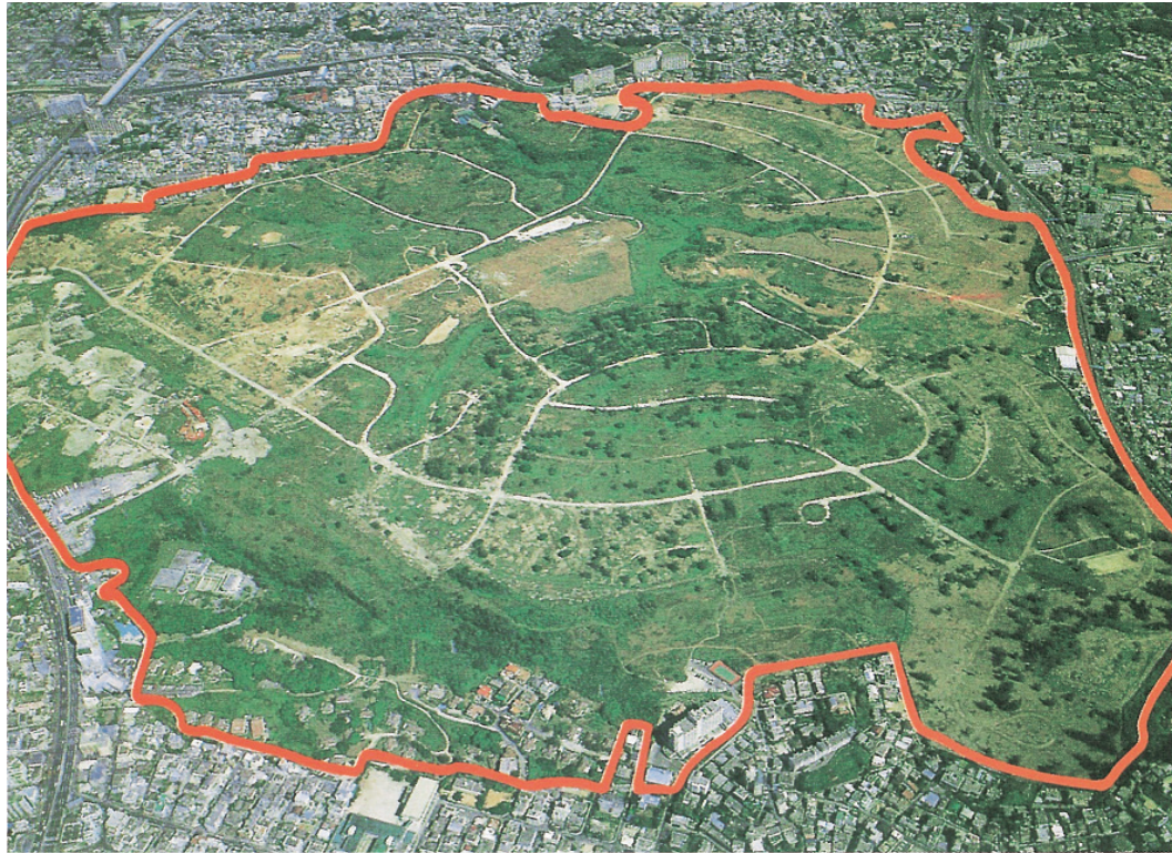
返還前の牧港住宅地区