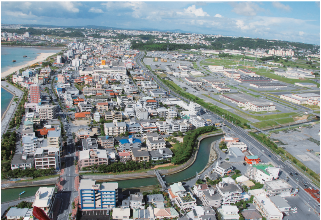
2005(平成17年)撮影