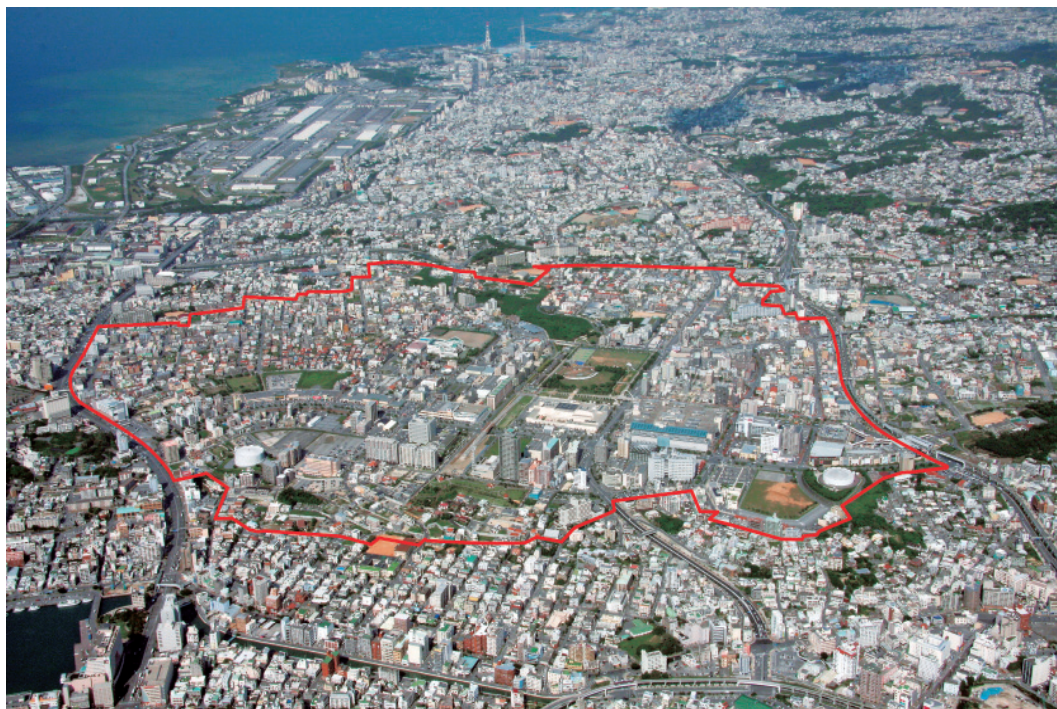
返還後の牧港住宅地区