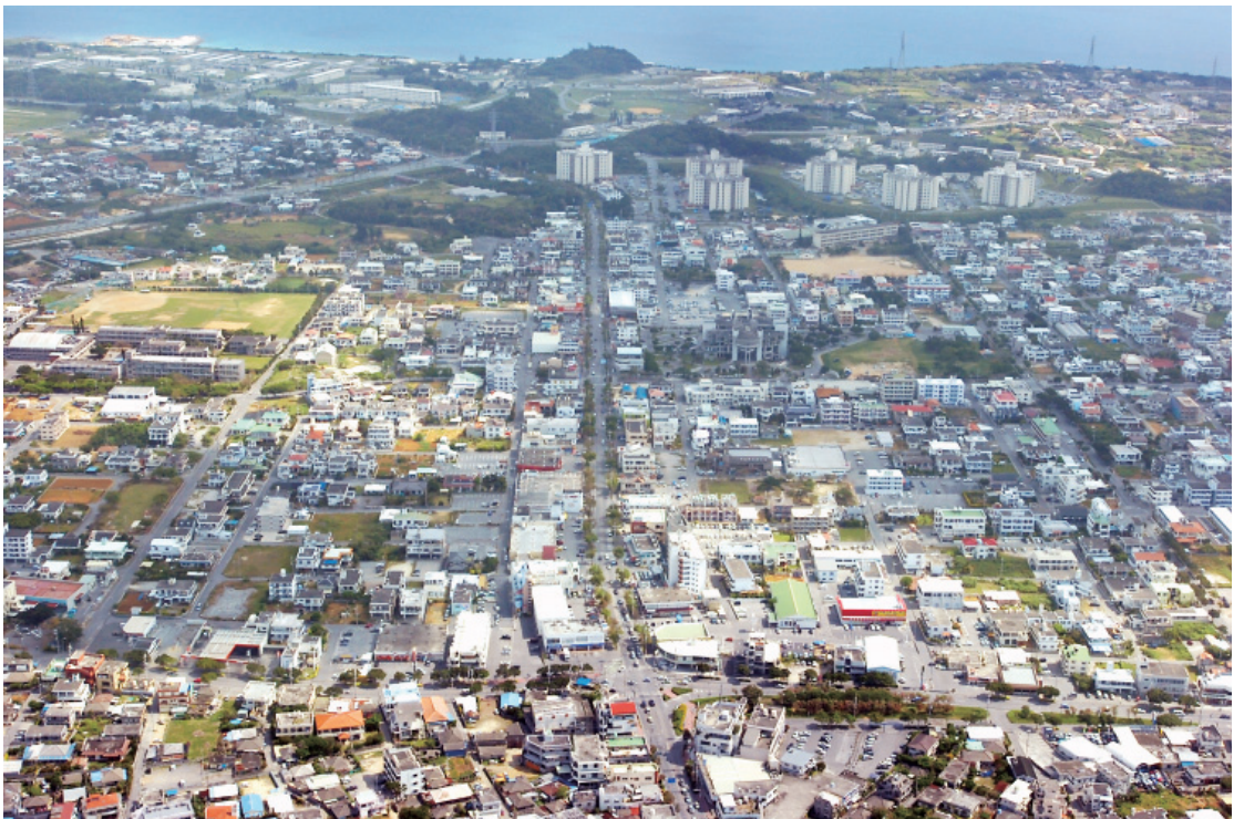
2005(平成17年)撮影