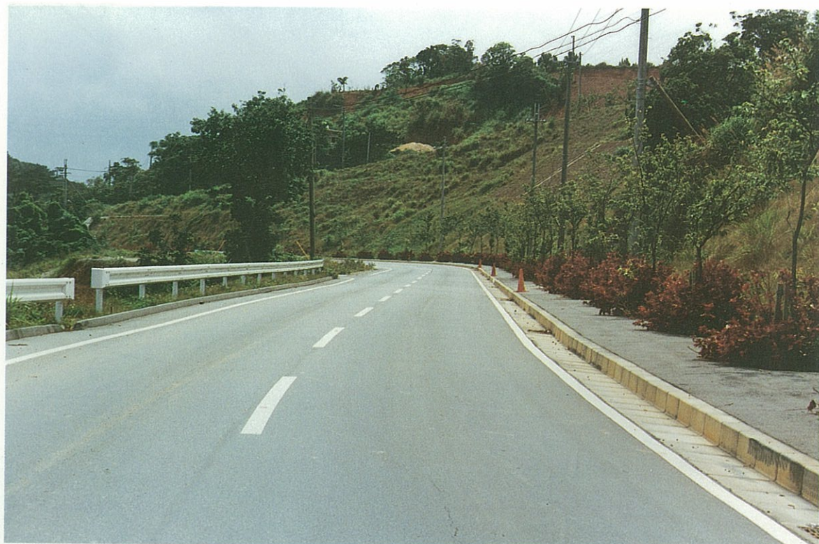
この付近は、道路幅員が狭少で交通の難所であった。