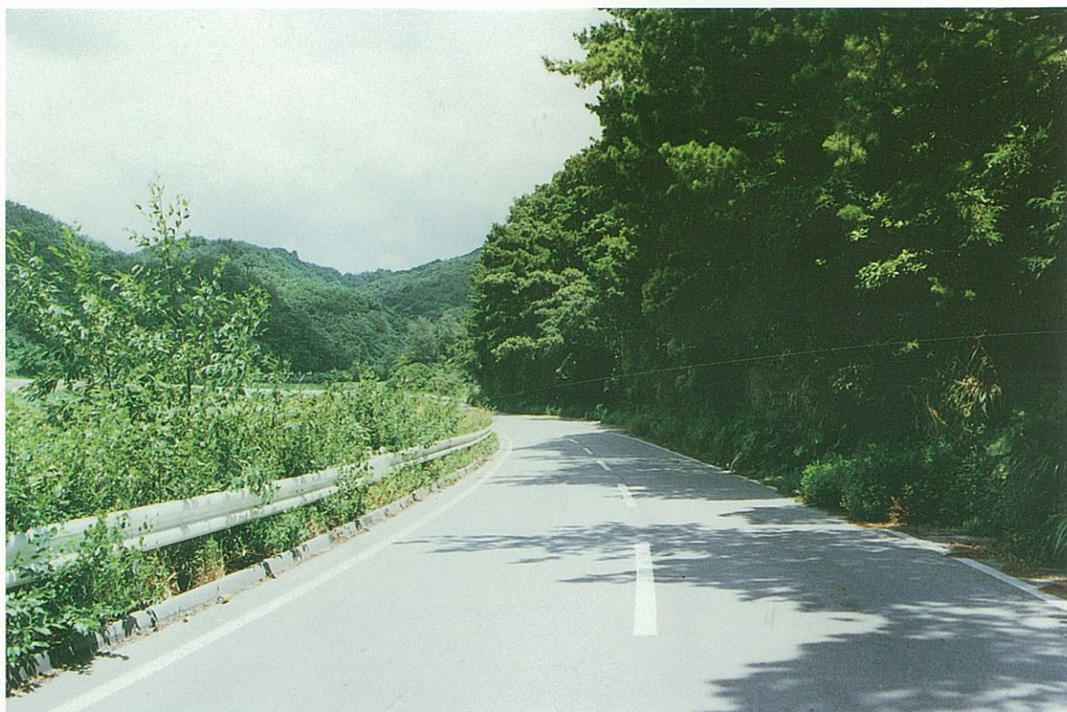
大宜味村白浜付近