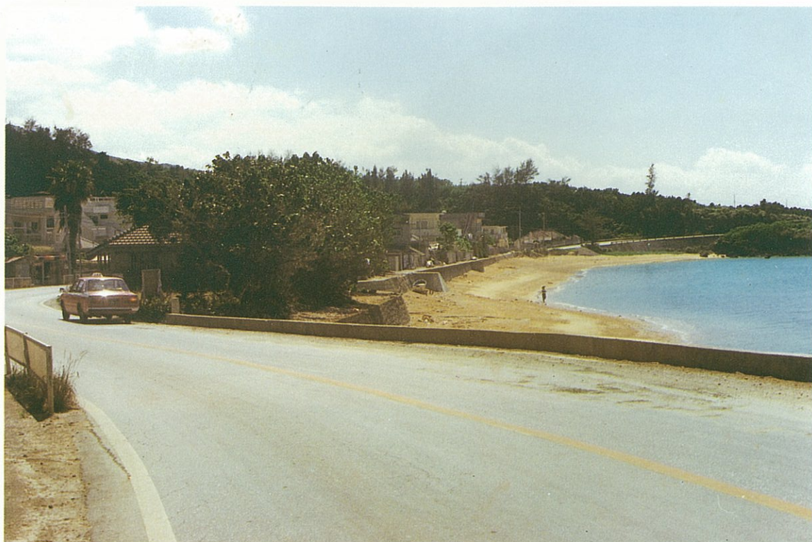
本部町崎本部付近