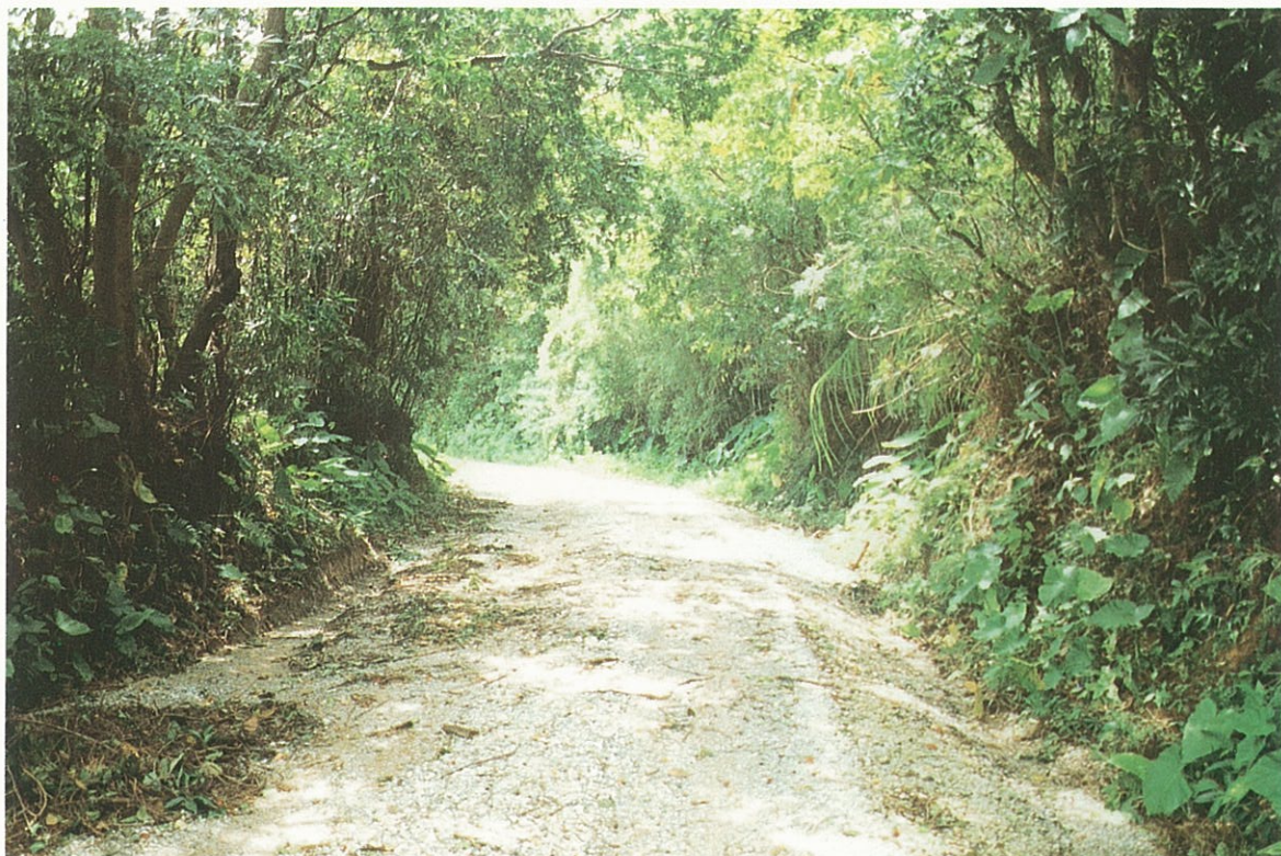
今帰仁村吳我山付近