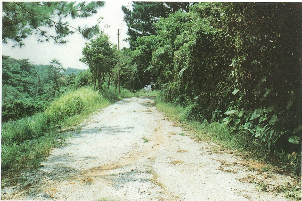
今帰仁村呉我山付近