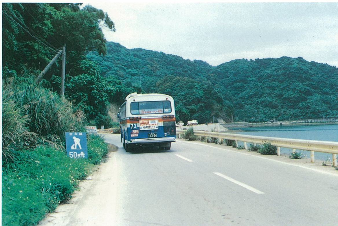
大宜味村屋古付近