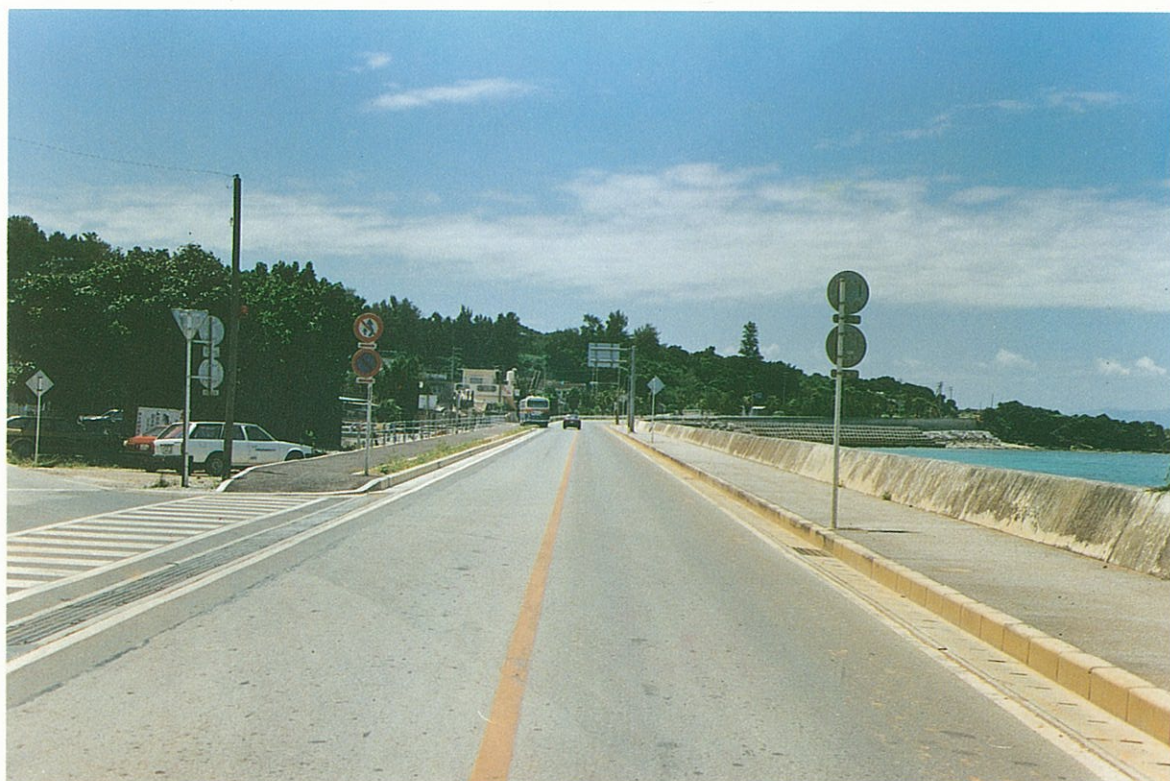
旧道は、集落内に急カーブがあり、交通事故の多い所であった。