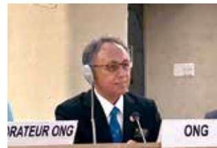
国連人権理事会本会議でスピーチを行う玉城知事

また、「米軍基地による人権・自治・環境問題」をテーマにした講演会や国連特別報告者などとの面談を行い、沖縄の過重な基地負担や辺野古新基地建設の問題に加え、これらの問題が沖縄だけの問題ではなく、人権、民主主義、環境の問題という普遍的な問題であることについて、国際社会に訴えました。