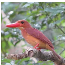
リュウキュウアカショウビン