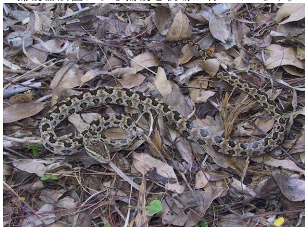
図1. 名護市で捕獲した台湾ハブ

対策として、分布が確認された市町村では、ハブ捕獲器設置による捕獲を役場が行っています。