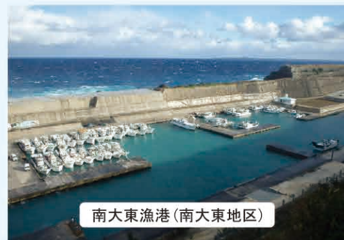
南大東漁港(南大東地区)