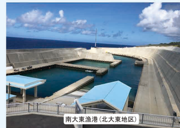
南大東漁港(北大東地区)