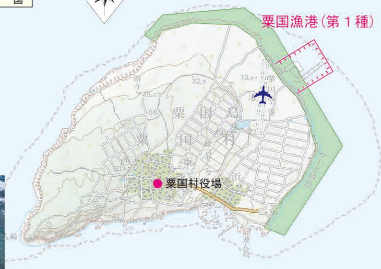
国土地理院発行5万分1地形図を加工して作成