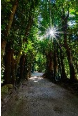
『備瀬のフクギ並木』 (城間さん、那覇市)

沖縄を代表する防風林といえば備瀬のフクギ並木。海岸近くの集落を台風や季節風から守る。それは生活の中から育まれた先人からの贈り物。また暑い真夏の日差しを遮り、心地よい木陰を作り、そこを風が吹いていく。