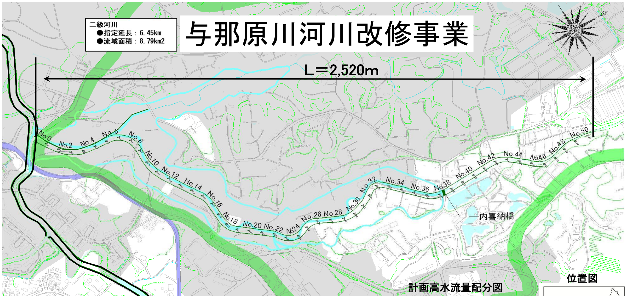
計画高水流量配分図