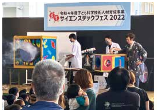
県内の子どもたちに科学技術の魅力や楽しさを伝えるイベント

県では、OISTを始めとする県内大学や研究機関、企業などと連携し、未就学児から高校生まで、成長段階に応じた科学体験プログラムを県内各地で実施するとともに、県内大学などの理系人材と県内企業などのマッチングを支援しています。これらの取組により、将来の科学技術の振興発展を担い、イノベーション・エコシステムを支える人材を育成していきます。