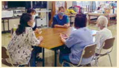
認知症に関する本人及び家族の相談会の様子

認知症カフェとは、認知症の人、家族介護者や友人、地域住民、専門職など年齢や所属、地域に関係なく身近で入りやすい場所で開催される集いの場です。参加者はお互いにコミュニケーションや情報交換を気軽に行うことができます。