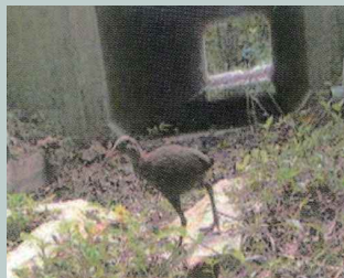
県道2号線のアンダーパス

本島北部のやんばる地域は、亜熱帯の森林が広がり、ヤンバルクイナ等の多くの固有種が生息していますが、その稀少動物が路上へ出現し、交通事故にあっています。