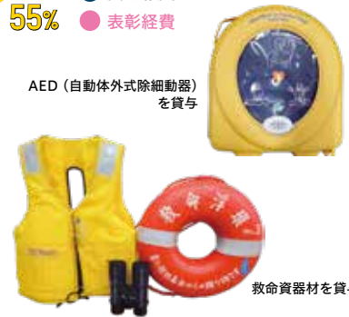
救命資器材を貸与