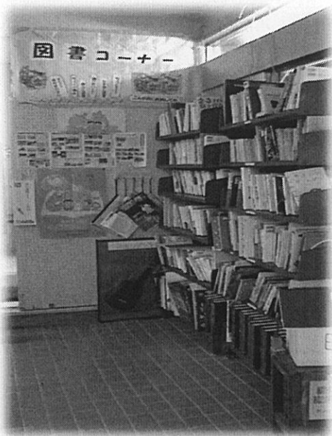
「宮古青少年の家図書コーナー」