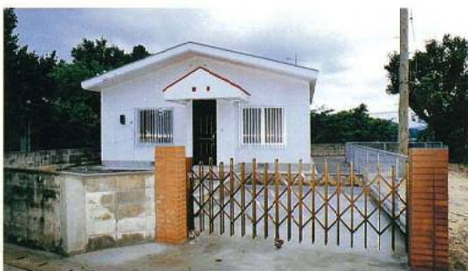
名称：県立西表西部診療所看護婦住宅 新築工事 所在地／竹富町 工期／H6.9.27～H7.2.23 構造／RC造(地上1階建) 延面積／54m 2 総工事費／24,812千円