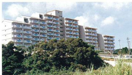
名称：県営宇茂佐第二団地建設工事 所在地／名護市 工期／H5.9.16～H7.3.22 構造／RC造(地上9階建) 延面積／7,472m 2 総工事費／1,602,264千円