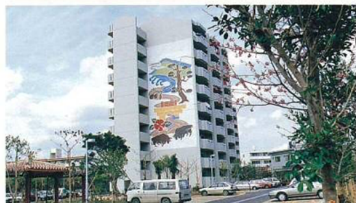
名称：県営松本高層住宅建設工事 所在地／沖縄市 工期／H5.8.30～H7.1.30 構造／RC・SRC造(地上10階建) 延面積／7,495m 2 総工事費／1,752,126千円