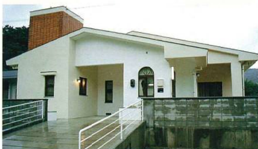
名称：県立座間味診療所医師住宅 新築工事 所在地／座間味村 工期／H6.9.21～H7.2.17 構造／RC造(地上1階建) 延面積／80m 2 総工事費／30,878千円