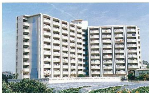
名称：県営外間高層住宅建設工事 所在地／南風原町 工期／H5.1.21～H6.9.26 構造／RC造(地上10階建) 延面積／11,391m 2 総工事費／2,457,005千円