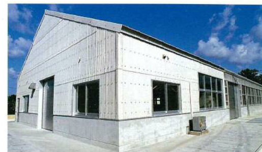
名称：水産試験場八重山支場施設 整備第二期工事