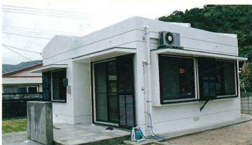
名称：県立渡嘉敷診療所看護婦住宅 改築工事 所在地／渡嘉敷村 工期／H6.9.21～H7.2.17 構造／RC造(地上1階建) 延面積／51m 2 総工事費／19,504千円