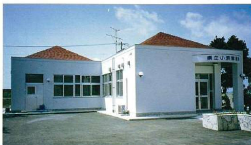
名称：県立小浜診療所新築工事 所在地／竹富町 工期／H6.9.28～H7.3.16 構造／RC造(地上1階建) 延面積／164m 2 総工事費／74,160千円