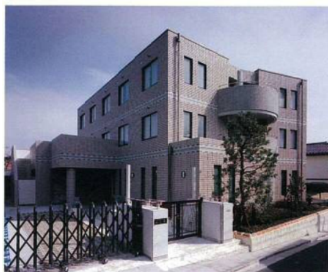
敷地は世田谷区の第1種住居専用地域で工事の施工に当たっては周辺環境への配慮が必要であった。

名 称 / 沖縄県立女子学生寮建設工事 所 在 地 / 東京都 工 期 / H5.6.18～H6.3.15 構 造 / RC3階 延 面 積 / 681.66㎡ 総工事費 / 327,849千円 設 計 / (株) 国建 施 工 / 建築 : (株) 國場組 電気 : (株) 國場組 機械 : (株) 國場組