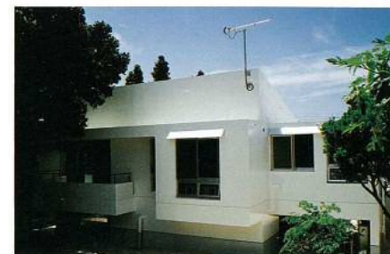
敷地全体が防風林のフクギで囲まれ極力、樹木を切らないよう設計に配慮した。屋根を片流れのモダンなデザインとし平面配置の北側の部分全体を高床にし通風と快適さを出している。