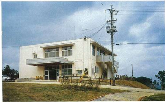
(県民の森) 森林学習館 ▶