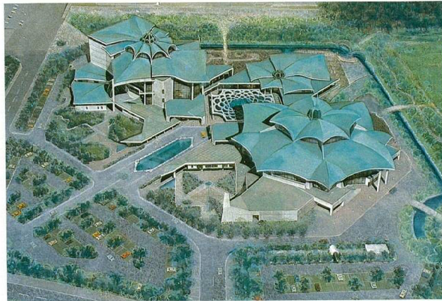
▼県民会館 (仮称) 透視図