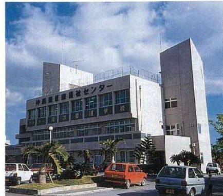
▲医療福祉センター