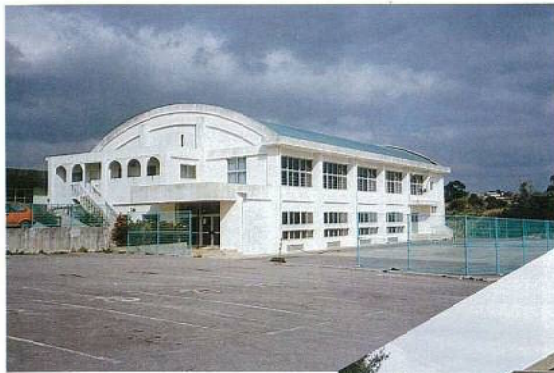
◀ 具志川職業訓練校体育館