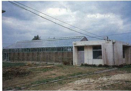
◀農業試験場ガラス温室