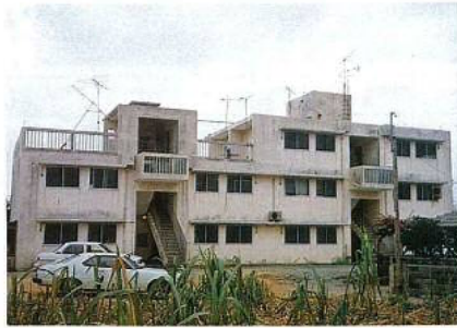
◀ 名護警察官待機宿舎