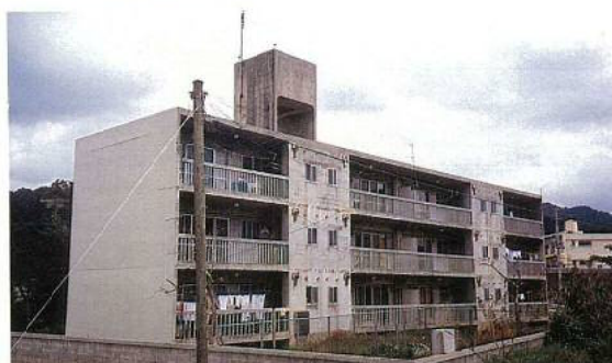
渡久地警察官待機宿舎▶