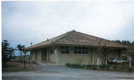
◀ (農業試験場名護支場) 農業技術展示館