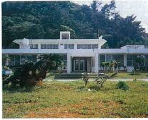
▲農業試験場園芸支場本館