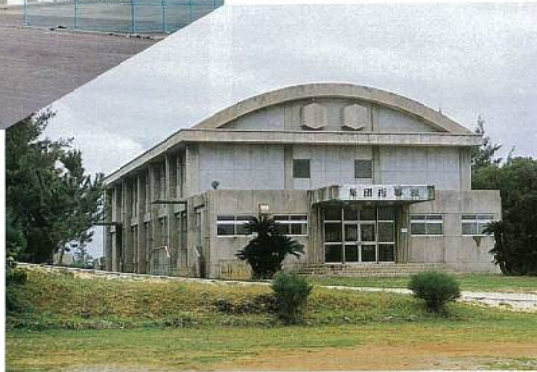
▶ 滋水学園集団指導棟