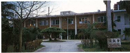
◀家畜衛生試験場本館