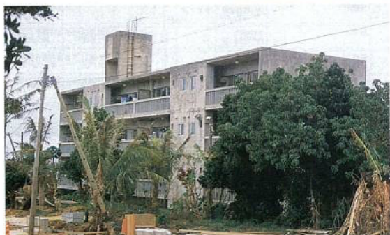
◀宮古警察官待機宿舎