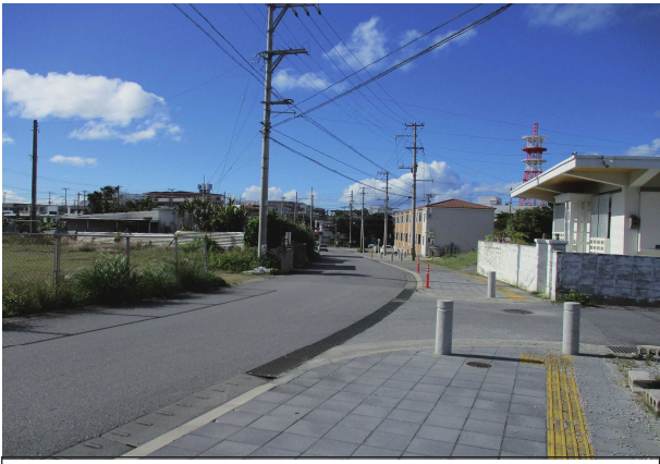
竹原 1 号線