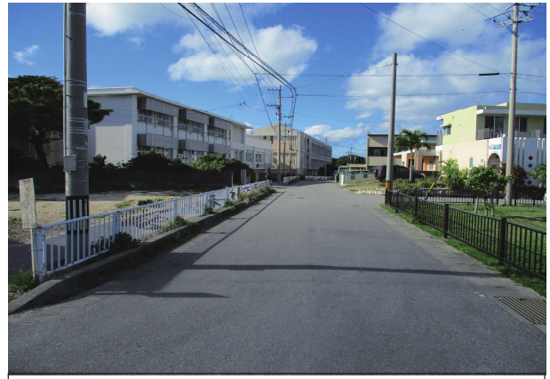
竹原 2 号線