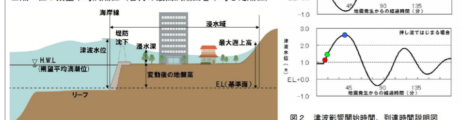
図2 津波影響開始時間、到達時間説明図

一「シミュレーション条件」一 ■想定地震：下図の16の想定地震について、地域海岸毎に影響の大きい想定地震を1～6つ選定 ■構造物：堤防等（盛土構造物）は比高75%沈下、防波堤等（コンクリート構造物）は設定なし ■潮位：朔望平均満潮位（各月の最高満潮面を平均した潮位）