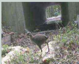
県道2号線のアンダーパス

本島北部のやんばる地域は、亜熱帯の森林が広がり、ヤンバルクイナ等の多くの固有種が生息していますが、その稀少動物が路上へ出現し、交通事故にあっています。