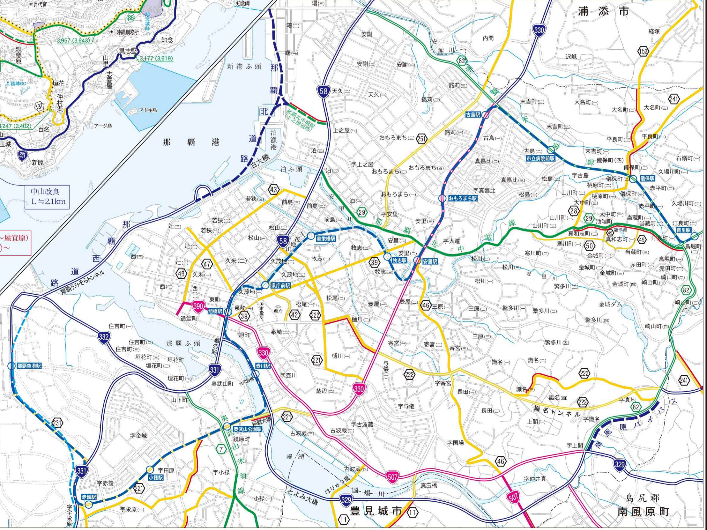
那覇市街図(略図) 縮尺 1:25,000