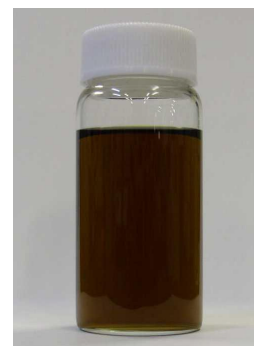
クミスクチンエキスBG (パンフレットより転載)

（独）産総研と共同出願した特許を活用して、日油株式会社より『クミスクチンエキスBG』として化粧品原料が製品化されています。