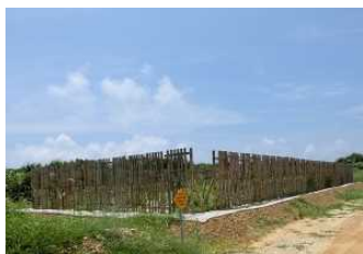
保安林緊急改良(久部良)