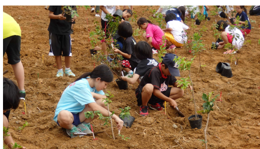
地元の小・中学生が育てた苗木を植樹 （苗木のスクールステイ）

また、今回は、「沖縄県CO 2 吸収量認証制度」を活用して平成28年度に認証された国頭村の緑化活動の権利の一部を、同植樹祭において排出される温室効果ガス（CO 2 ）のカーボン・オフセット（打ち消し）に活用しています。カーボン・オフセットにより環境に配慮した植樹祭を開催し、参加者・県民への普及啓発を図ります。