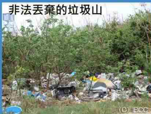
非法丟棄的垃圾山