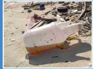
不知道裡面裝有什麼的瓶罐