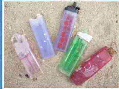
這邊也有各種的拋棄式打火機