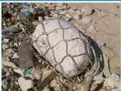
太輕容易飛散 又容易支離分散 真傷腦筋