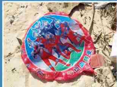
鹹蛋超人家族!? 從哪裡飛來的呀？