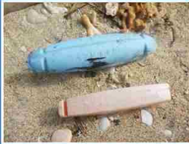
漁業用的浮標 顏色與形狀都不盡相同