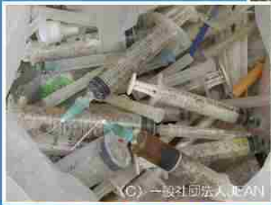
針筒、藥罐等醫療廢棄物