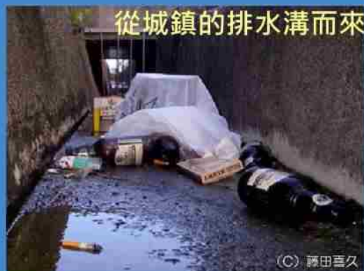
從城鎮的排水溝而來