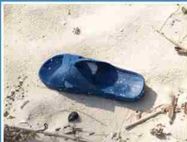
丟掉單腳拖鞋的人 難道沒有很傷腦筋嗎？