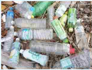
世上有許多種類不同的寶特瓶呢