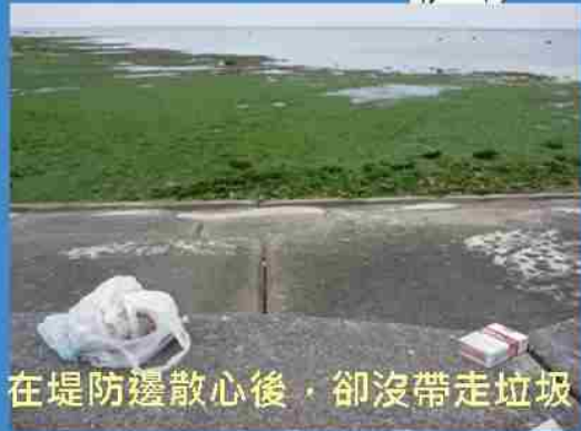
在堤防邊散心後，卻沒帶走垃圾