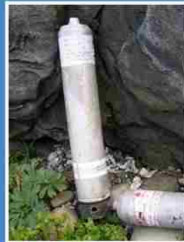
發焰筒 及軍方相關的用具