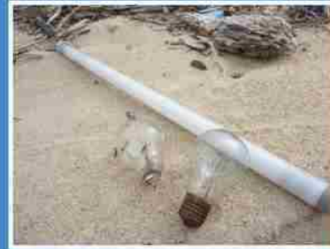
破裂後 很危險的物品