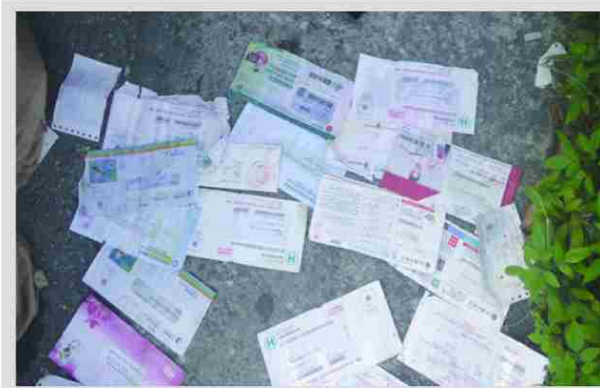
圖：花蓮郵局侯姓郵差到花蓮地檢署後策檢察官供稱已在清水斷丟了三年多郵件。這些是這次起出的丟棄郵件。

辦法準時送完，所以乾脆把郵件全部丟進海中，心想清水斷崖地勢高、風大，而且沒有人會攀爬下去，應該不會被發現，昨天向花蓮郵局主管說最近三個月內至少「丟包」三次。