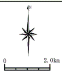
図 既存ヘリ着陸帯の位置