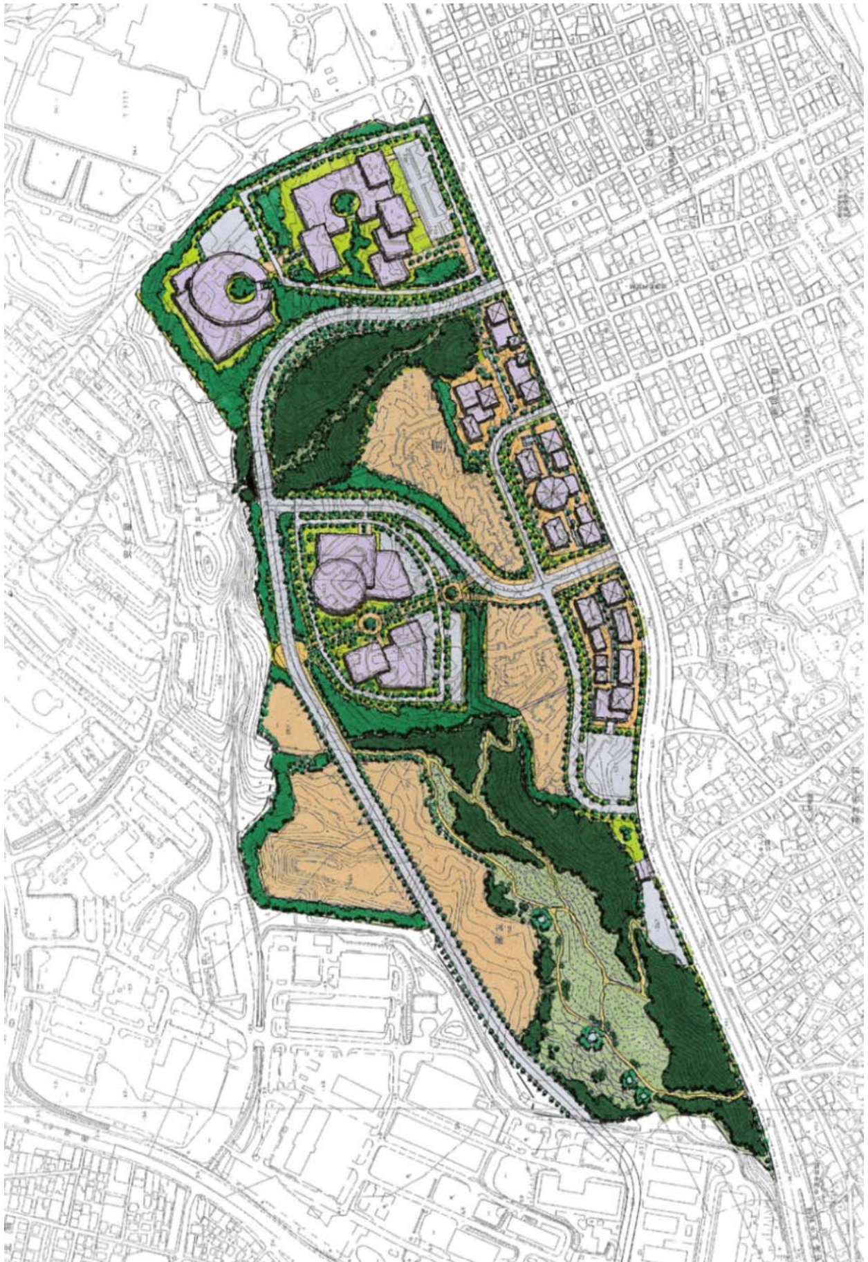
図 4-14 整備イメージ図