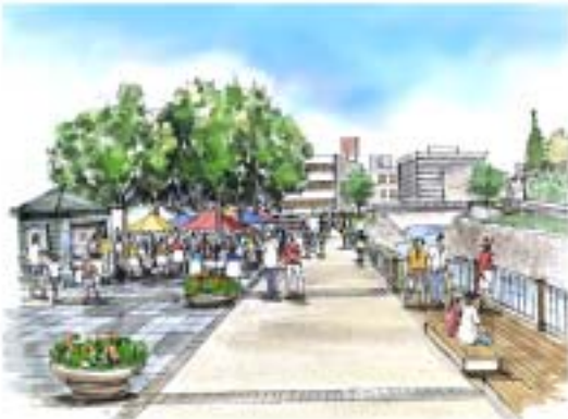
オープンカフェイメージ