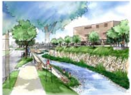
緑道及び親水テラスイメージ