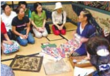
おきなわ県民カレッジ自主企画講座「紅型の世界」