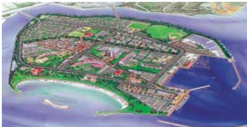
中城湾港(泡瀬地区)イメージ図