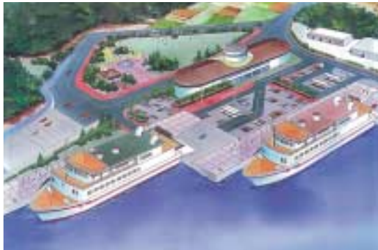
運天港上運天地区完成予想図