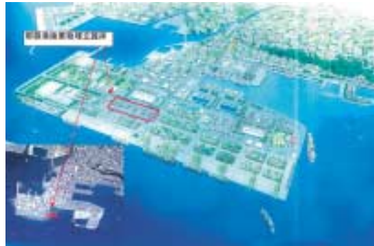
那覇港廃棄物埋立護岸イメージ図