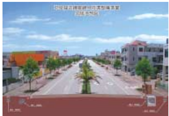
平良城辺線電線共同溝完成予想図