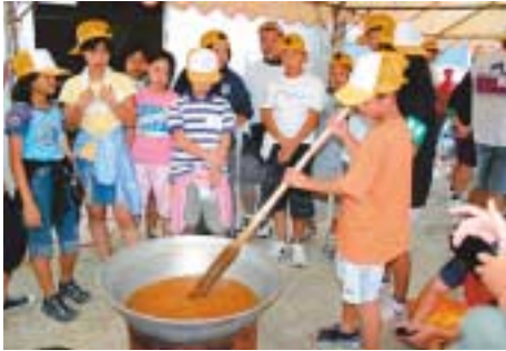
青少年交流体験事業