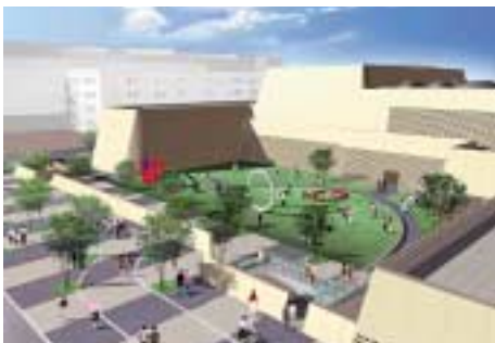
県立博物館新館・美術館