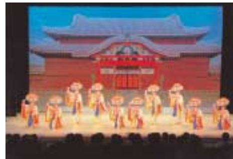
かりゆし芸能公演