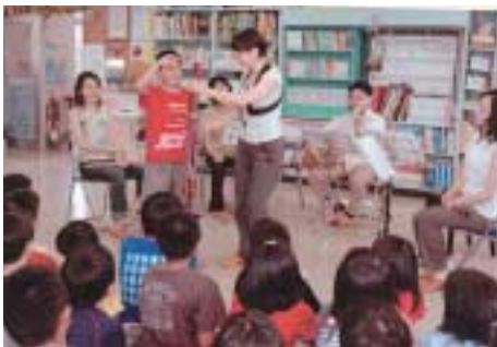
アウトリーチコンサート