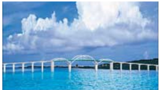
伊良部大橋イメージ図

生活環境基盤については、竹富町等のごみ焼却施設等の整備など廃棄物の適正処理を促進するとともに、儀間ダム及びタイ原ダムを整備するほか、大浜磯辺地区等の集落排水施設を整備します。