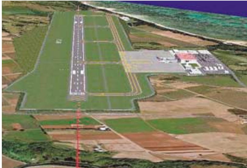
新石垣空港完成予想図