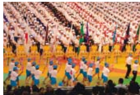
全国高等学校総合体育大会開会式(千葉県)