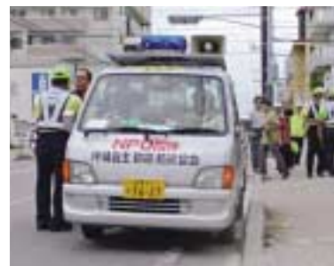
青色回転灯装着車によるパトロール