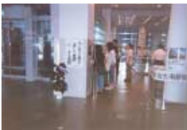
ハンセン病回復者等名誉回復事業

ハンセン病に対する偏見や差別を解消するため、ハンセン病の歴史的な検証をもとに正しい知識の普及啓発を行うとともに、回復者等の社会生活の支援に努めます。