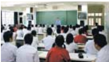
安全学習支援隊による授業風景