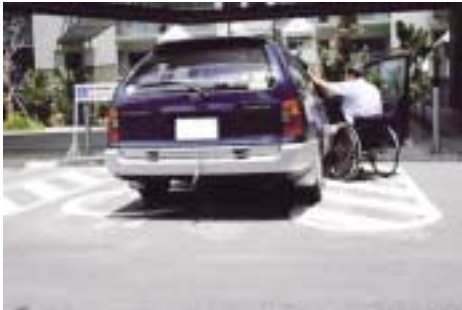
車いす使用者専用駐車場