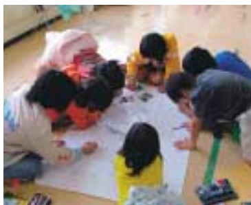
子どもたちによる地域安全マップの作製