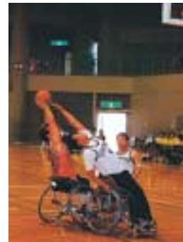
車いすバスケット