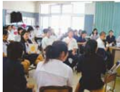
高校生向け就職セミナー(沖縄県キャリアセンター)