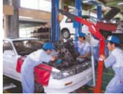
職業能力開発校における訓練 (自動車整備科)