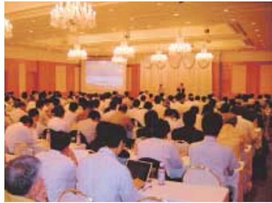
企業誘致セミナー

豊見城市地先開発事業を促進し、物流関連企業などの誘致を強化し臨空空港型産業の立地を図ります。