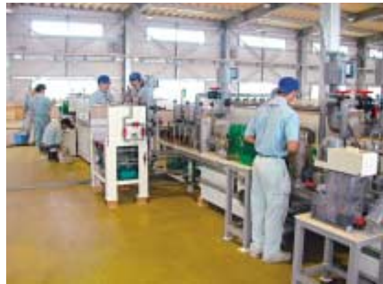
特別自由貿易地域内進出企業