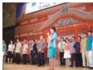
かりゆしウエア ファッションショー

建設業の新分野・新事業への進出等を支援するとともに、構造改善の促進など建設業の健全な発展に努めます。