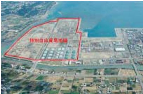
特別自由貿易地域