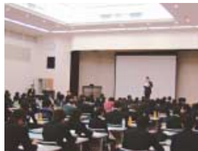
大学生向け就職セミナー(沖縄県キャリアセンター)