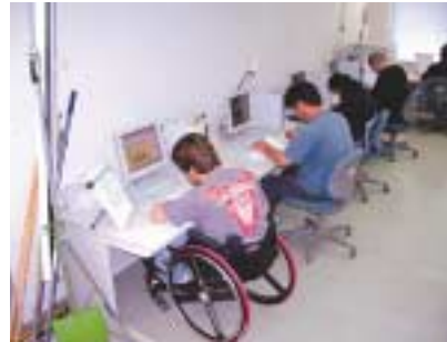
職業能力開発校における訓練 (OA事務科)