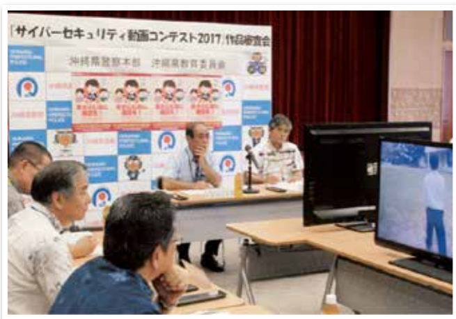
サイバーセキュリティ動画コンテスト審査風景