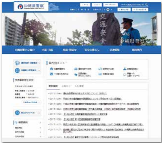
県警ホームページトップ画面

楽しく便利なネット社会の裏側には様々な危険が潜んでいます。安全で安心してインターネットを利用するためには、正しい知識を身につけて被害を未然に防ぐことが大切です。