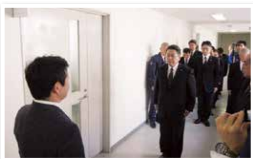
サイバー犯罪対策課発足式の様子