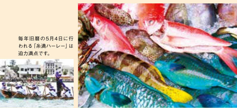
毎年旧暦の5月4日に行われる「糸満ハーレー」は迫力満点です。

沖縄本島の最も南に位置する糸満市は、古くから漁師町として栄え、海人(ウミンチュ)のまちとして知られています。人々の暮らしには今も旧暦文化が根付き、伝統行事の多くが旧暦に沿って行われます。中でも豊漁を祈願する肥龍船競漕・糸満ハーレーは、毎年3万人以上の観客が訪れるほど。舞台となる漁港で緑り広げられる海の男たちの熱い闘いの様子は圧巻です。また、農業も盛んで、小菊の生産量は県内一を誇ります。拠点産地にも認定されていて、たくさんのお菊が正月や彼岸の飾り花として県外へ出荷されています。そして、忘れてはならないのが戦争の記憶。ひめゆり学徒の慰霊碑「ひめゆりの塔」や恒久平和を願い建てられた平和祈念公園は、戦争の悲惨さや命の大切さを次世代へ伝えていきます。