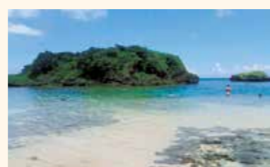
住 沖縄県八重山郡竹富町上原 P あり