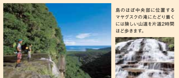
島のほぼ中央部に位置するマヤグスクの滝にたどり着くには険しい山道を片道2時間ほど歩きます。