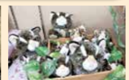
イリオモテヤマネコをモチーフにしたユニークな商品がたくさんあります。