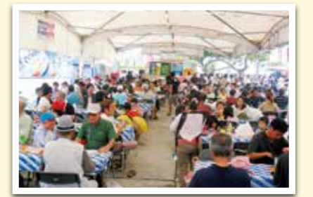
オリオンピアガーデンの様子

オリオンピアガーデンや農林産業展など、県産品の魅力が詰まったイベントを開催しています。詳しくは事務局へお問い合わせください。