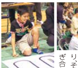
◆ スワイク ワークショップ… パソコンで自由に制作をする体験ができます。

ITを体験してみよう! IT津梁まつりでは、県内のIT関連企業の仕事とIT技術系の学科がある学校等を紹介するブース出展や、実際にロボットやパソコンを使ってITを体験するといった、広く県民の皆さまにIT関連産業に興味と関心を持ってもらうためのイベントです。