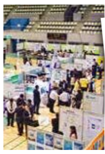
(右) 津梁まつり2015 ポスター

IT関連企業の仕事、IT技術を学べる学校を見てみよう! IT津梁まつりでは、例年30社以上のIT企業が自社の事業内容、製品を紹介し、体験コーナーも設けています。昨年は、スマートフォンアプリを開発する企業、3Dプリンターを扱っている企業、音楽制作・モニタリングを行う企業、レーシオンを行う企業など、私たちの生活で身近なものから最新技術までを扱う様々なIT企業が出展し、今年も出展予定です。また、IT系教育機