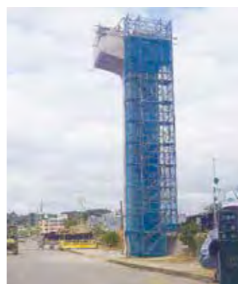
国際センター付近の支柱

平成27年度は引き続き支柱の工事を進めるとともに、駅舎の支柱や軌道桁、地下区間の工事にも取組む予定です。沿線での民間開発も活発になっており、県では、今後も平成31年の開業に向け工事を進めていきます。