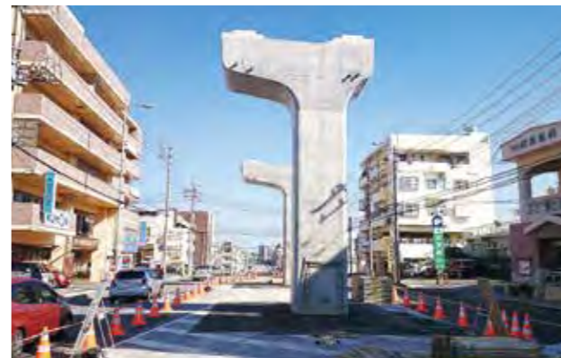
首里りうぼう付近の支柱

現在、県が進めているモノレールの延長工事は、終点となっている首里駅から新たに首里石嶺や浦添市内の3駅を通り、沖縄自動車道と結節させることにより、新たな公共交通ネットワークの形成を図るものです。これにより、中北部から那覇都市圏へのアクセスが向上するとともに交通渋滞の緩和、駅周辺のまちづくりによる沿線地域の活性化などが期待されています。