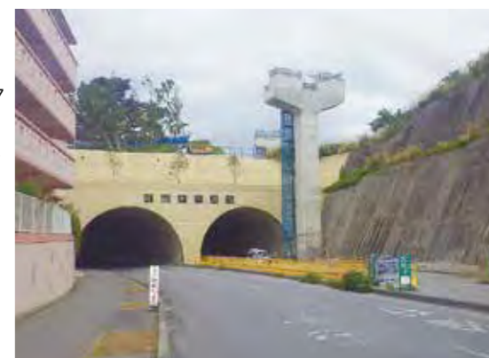
前田トンネル前の支柱

平成25年度に始まった延長工事は、現在、着々と進んでおり、那覇市の首里りうぼう前や浦添市の前田トンネル付近では、既に完成したレールを支える支柱を見ることが出来ます。