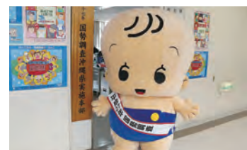
イメージキャラクター「センサスくん」

国勢調査は、日本国内に住むすべての人と世帯を対象とする国の最も重要な統計調査で5年ごとに行われている。平成27年の実施に伴い沖縄県実施本部が設置され、県統計課で看板掲揚式が行われた。街頭キャンペーンでは、イメージキャラクター「センサスくん」も参加してチラシ配布等のPR活動を行った。 調査は9月から実施する予定で、今回からスマートフォンやパソコンからも回答が可能になる。