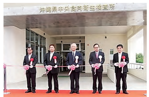
テープカットの様子

南城市大里にある県中央食肉衛生検査所は昭和54年に建築されたが、施設の老朽化のため平成24年度から建て替え事業を開始、平成27年3月にすべての工事が完了し、開所式を開催した。開所式では、浦崎副知事のあいさつやテープカット、検査室内覧会などが行われた。 食肉、食鳥の安全確保の検査機関として、新庁舎では時代に即した検査体制の整備強化をはかるとともに、検査技術の二層の向上を図っていく。