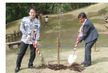
アメリカから送られた友好の木「ハナミズキ」植樹式典