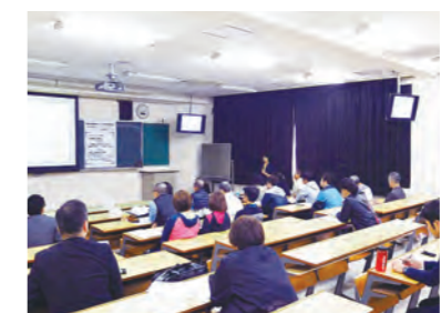
「総合型地域スポーツクラブによる県民健康力アップ」意見交換会