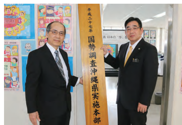
副本部長と事務局長による看板掲揚

国勢調査は、日本国内に住むすべての人と世帯を対象とする国の最も重要な統計調査で5年ごとに行われている。平成27年の実施に伴い沖縄県実施本部が設置され、県統計課で看板掲揚式が行われた。街頭キャンペーンでは、イメージキャラクター「センサスくん」も参加してチラシ配布等のPR活動を行った。 調査は9月から実施する予定で、今回からスマートフォンやパソコンからも回答が可能になる。