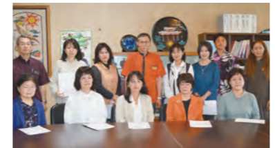
沖縄県伝統工芸製品検査員辞令交付式 検査員の皆さん