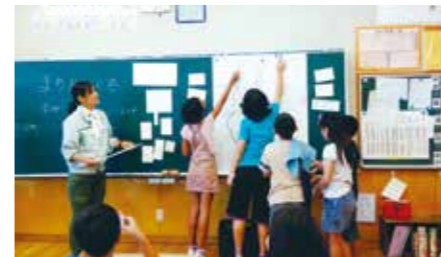
小学校出前講座での学習風景