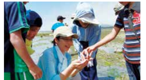
海辺の自然観察会