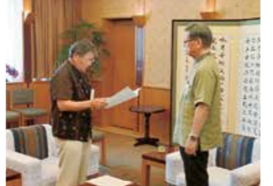
県産品優先使用について翁長知事へ要請