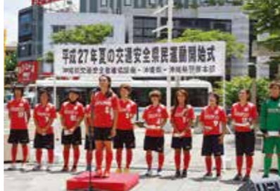
女子サッカーチーム「琉球デイゴス」による交通安全宣言