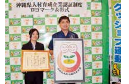
沖縄県人材育成企業認証制度 ロゴマーク表彰式