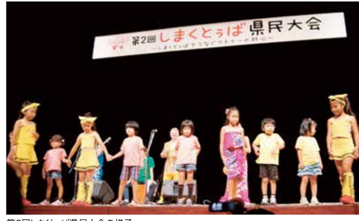
第2回しまくとぅば県民大会の様子

推薦を受けた話者が集結して、大会 を大いに盛り上げてくれます。 小さな子どもから高齢者まで、色々 な話者の話を聞くことができ、大いに 楽しんでいただけると思っていますので、多 くの方々のご来場をお待ちしています!