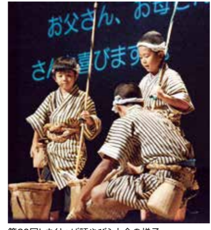
第20回しまくとぅば語やびら大会の様子