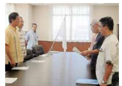
沖縄防衛局で要望書を手渡す様子(県内企業優先発注要請)