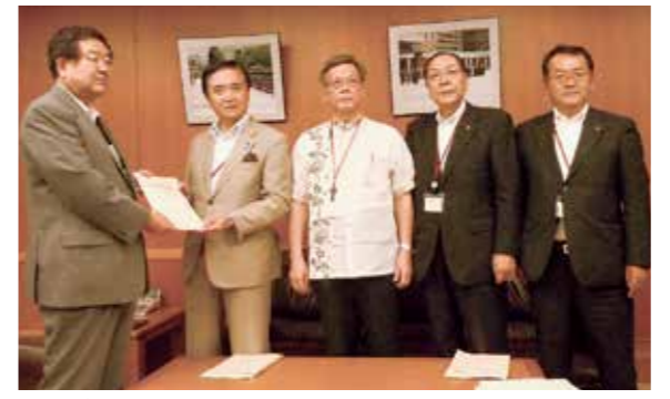
左藤防衛副大臣に要望書を手交

米軍基地が所在する14都道府県の知事で構成する渉外関係主要都道府県知事連絡協議会(渉外知事会)の総会が東京で開かれ、翁長知事が出席した。 日米地位協定の見直しをはじめとする基地対策に関する要望書などについて審議した後、会長の神奈川県知事らとともに防衛省、外務省や在日米国外使館に赴き、要望書を提出した。