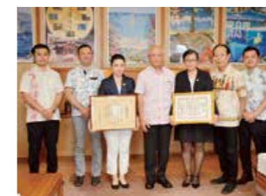
泡盛マイスター協会 技能大会受賞者報告