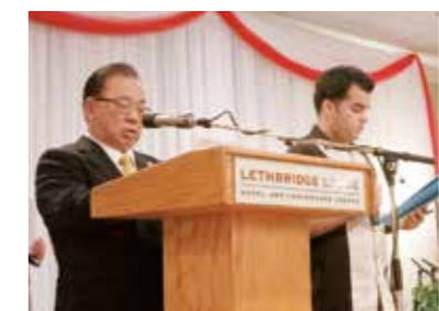
カナダ移民115周年記念式典であいさつをする安慶田副知事