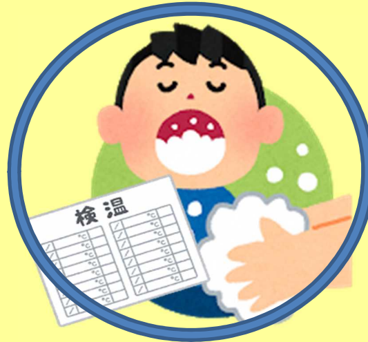
手洗い・うがい・検温の習慣を！