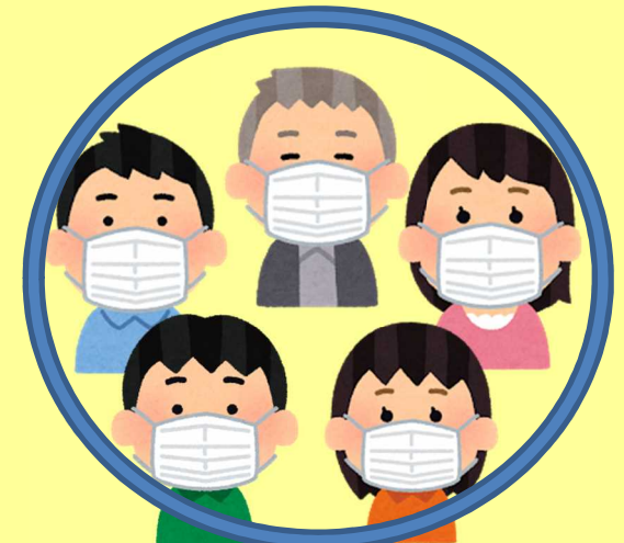
高齢及び有症状の家族と接する時には、マスクをつけましょう