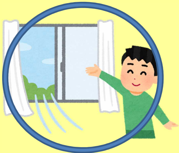
定期的に換気をしましょう