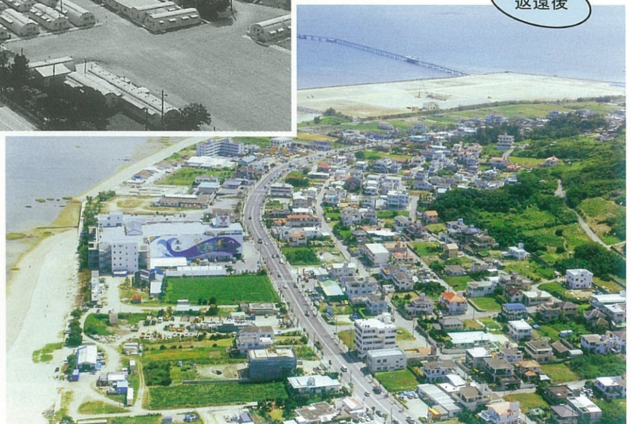
平成17年4月