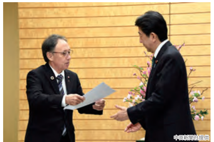
玉城知事から安倍内閣総理大臣への県民投票結果の手交